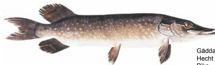
Gädda Hecht Pike