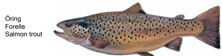
Öring Forelle Salmon trout

12. Violation and force majeure: Fishermen who do not follow the rules, or whose general conduct is a disturbance to others, may be banned from further fishing in the waters of Harasjömåla Fiskecamp. Any violation of the Harasjömåla Fiskecamp rules, resulting in the confiscation of your permit, does not entitle you to a complete or partial refund of your fee. The same applies with force majeure, e.g. if ice or snow prevent fishing.