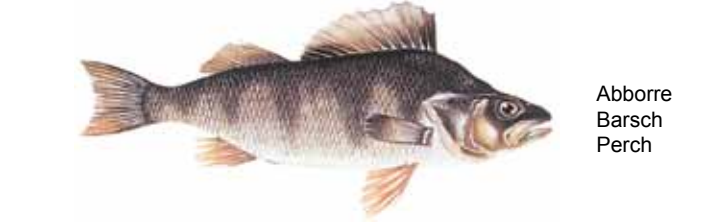
Abborre Barsch Perch