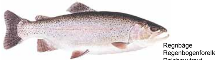
Regnbåge Regenbogenforelle Rainbow trout